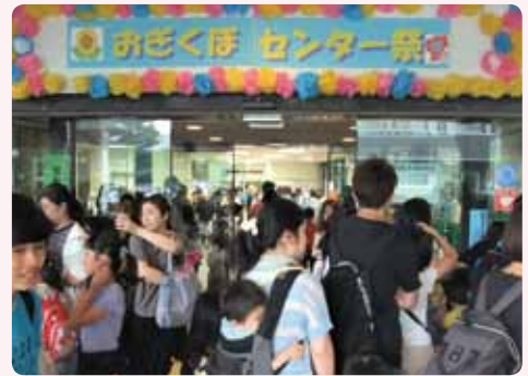
正面エントランスの賑わい

雨まじりの天気にも関わらず2,230名の来場者があり、とても賑わいました。15の舞台プログラム、スタンプラリー、プラネタリウム、防災クイズ、缶バッジ、杉並の野菜直売、南伊豆町の物販、模擬店など、大人も子どももたくさんの方々楽しんでいただきました。