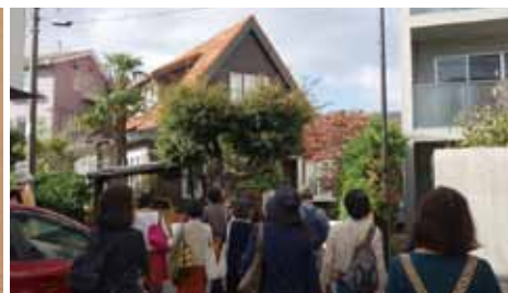
応援団が主催したまち歩きの様子