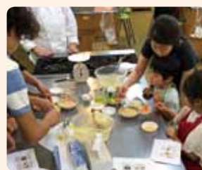
手づくりマヨネーズ体験