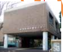
荻窪地域区民センター