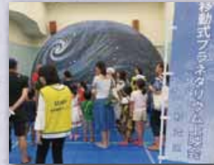
移動式プラネタリウム

似顔絵・鉄道模型運転ほか様々な展示やワークショップが催されました。ロビーや屋外には産直品などの物販や模擬店が並び、協議会自身も模擬店・缶バッジ・スタンプラリーなどを実施し、イベントの盛り上げに努めました。地域の皆様のご協力の下、小さな子どもたちから高齢の方々まで、楽しんでいただくことが出来ました。