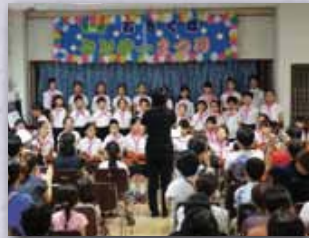
桃二小早朝合唱合奏クラブ

舞台では、小中学生のコーラス・吹奏楽、おやじバンド・フラダンス・伝統芸能、高齢者のファッションショーなど16の多彩な出し物が演じられました。体育室や集会室では、プラネタリウム・