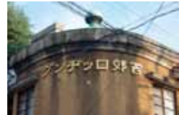
本天沼区民集会所