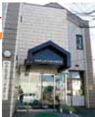
本天沼区民集会所