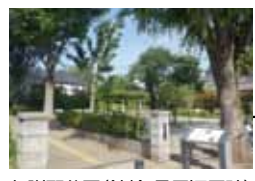
荻窪地域区民センター