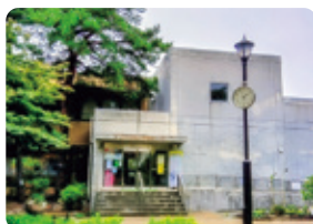
郷土博物館の分館外観

*デジタル・アーカイブ化：インターネット等を通じて公開するために博物館資料をデジタル化して保存すること。