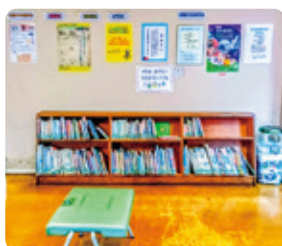
絵本などが置いてある休憩スペース

館長から 開館以来、身近で親しまれる博物館としてさまざまな事業に取り組んでいますが、皆さんにもっと知って利用していただきたいです。町づくりを進める中で昔のことを知り学ぶことは大切です。そのためのお役に立ちたいと思っています。未来を考えるためにも、ぜひ博物館を活用してください！